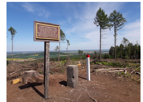
Nummer 14 Gauß-Stein Deister I