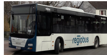
Von Montag bis Freitag mit dem Regio-Bus auf den Deister-Kamm

Der Deisterkamm ist die Grenze zum Stadtgebiet Springe. Der überwiegende Teil des Deisters gehört zum "Calenberger-Bergland" und liegt im südwestlichen Teil der Region Hannover. Mit 405 m. ü. NHN (auf dem Bröhn/Annaturm) ist der Deister Deutschlands nördlichster Vierhunderter.