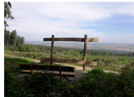
Nummer 8 Müllers-Höh